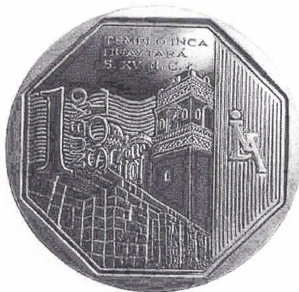
TEMPLO INCA HUAYTARÁ – Siglo XV a C.